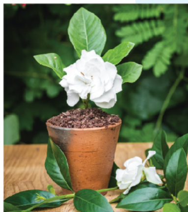
M Satisfaction 250 Vodka, Milk, Chocolate Reduction, Edible Chocolate Soil, Caramelised nuts, Seasonal Flowers