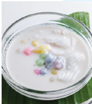
Bua Loy Rice Balls In Coconut Milk