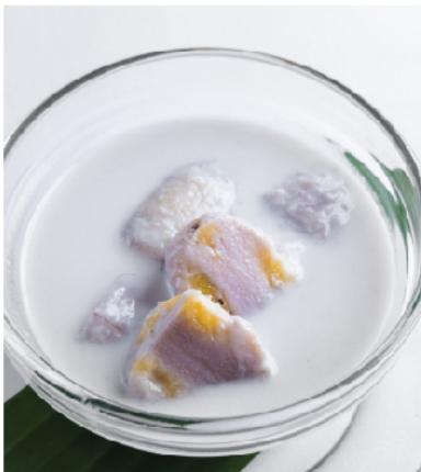
Gluay Buad Chee Sweet Banana In Coconut Milk