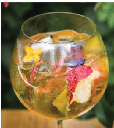
Floral G & T 250 Floral Gin, Pimm's NO 1, Floral Tincture, Dry Martini, Tonic, Assorted Herbs and Flowers

M Watermelon Smash 220 Vodka, Watermelon, Ginger, Lime Juice, Mint Leaves, Rose, Soda Water