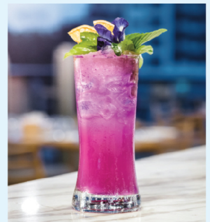
M Lakeside Rhapsody 220 Vodka, Aloe Vera Juice, Butterfly Pea Syrup, Soda Water