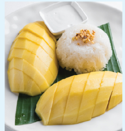
Mango and Sticky Rice Served With Crispy Mung Beans and Coconut Cream