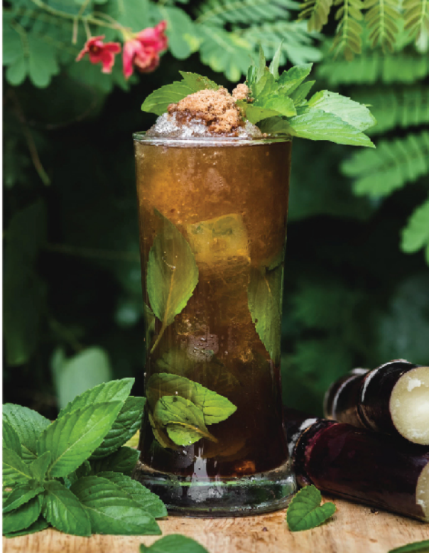
Mojito 200 Light Rum, Nichada Spearmint, Lime Juice, Brown Sugar

Vaportini 250 Gin, Bianco Vermouth, Jasmine Water, Lemon Zest